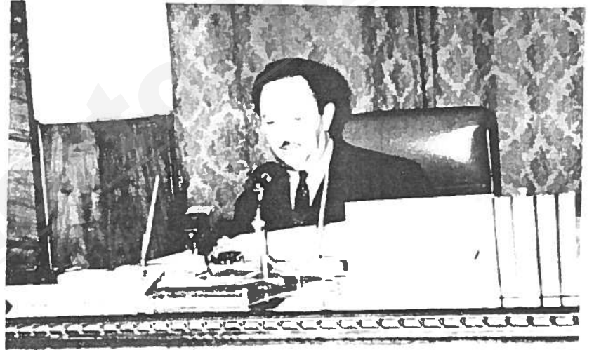
ለዐላ ጠርቆ አዝግቶ አባላ ጠባቢ ሥላሴ የኢትዮጵያ ን. ጠንግሥት አዳጋ ጠራሽ