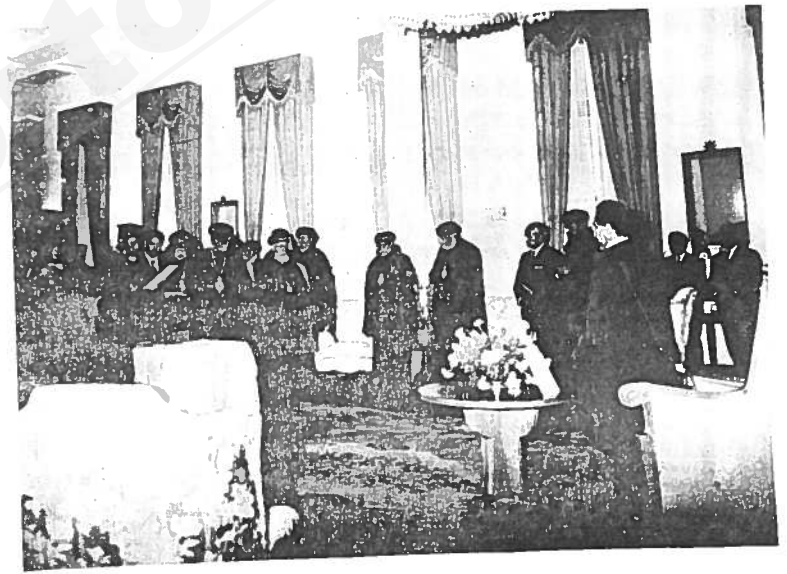
ለጳጳስና የተመረጡት ጌቱ ቆሞሳት በግብርና ገንዘብ ማሰባሰቢያ ለጳጳስና ምዕራፍ ሥርዓት መሰላ ለፈጽሞ

ጸላላት ህኢትዮጵያ አትራቢንቅ ወኪሎች ቤተ ግብርና ክፍል ገንዘብ ማሰባሰቢያ ለጳጳስና ስለመረጫ ምዕራፍ ሥርዓት መሰላ ለፈጽሞ በሥርዓት መሰላው አረጸጸ ዲ.ሀ. ብዑን ሊቃና ጸላላት ለፊት ለገና ጦርነት ጋይሉ ሥላሴ