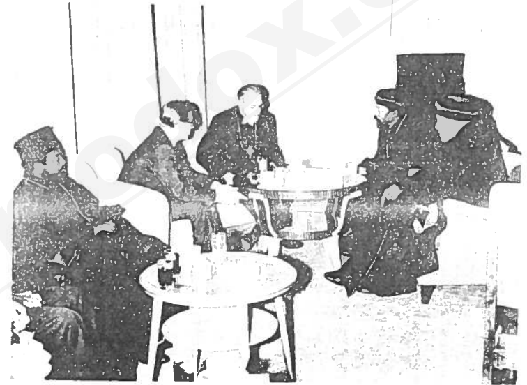
ቅዱስነታቸው በጽሕፈት ቤታቸው እንገና ሲቀበሉ ።