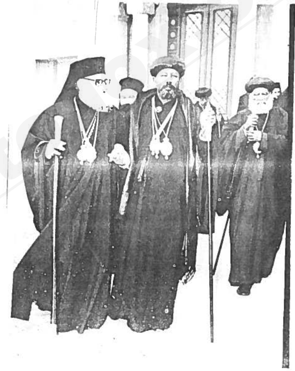
ጭፅ ወቅቶስ ተገግጧ ቴዎፍሉስ እስክንድርያ በደረሱ ጊዜ ብዑስ ወቅቶስ ኒኮላዎስ ቤተወላዳው ።

ዲደረግ ቅዱስነትም አጥፎተው የጣ ሩት በዚህ በኢትዮጵያ ቤተ ክርስ ቲያን ላይ ወለዎት ፍቅርና ሙሉ ከም ልዕተዎት የኢትዮጵያ ቤተ ክርስቲያንም ይህንን የምረቅ እር