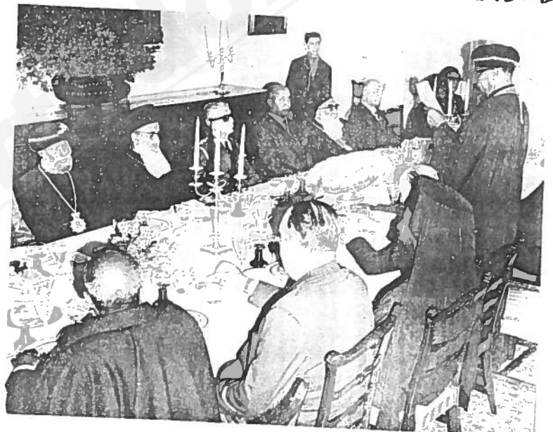
የላባታዎ በላ ከግሪክ ግሪክ መንግሥት ፀተደረጉት የእራት ገብነጥ ላይ ያደረጉት ግግር ላይ