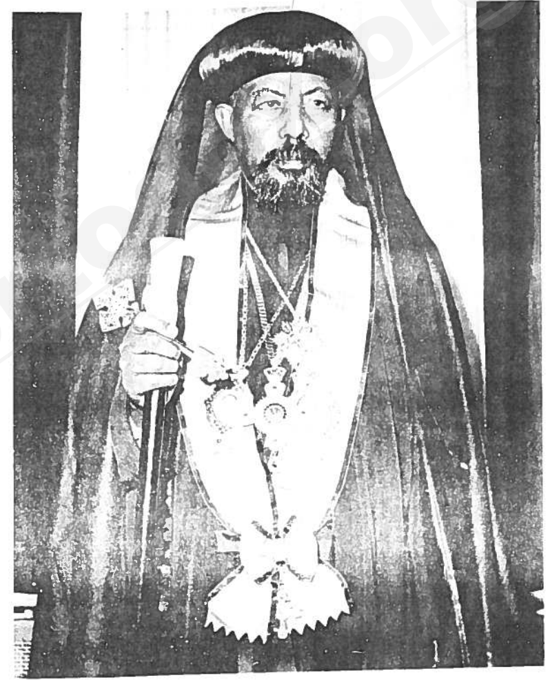
ገብሬ ጳጳስ ተታገሮ ገዳማጅ ፓትርያርክ ሮሎ ሊዎን ለሰነድ ዘኢትዮጵያ ።